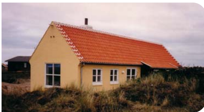
G1. Skagen 6 sengepladser, opvaskemaskine.

Pensionskassen for Farmakonomer har sommerhuse på Fanø og i Gammel Skagen. Fælles for husene er, at de er fuldt møblerede og har brændeovn som supplement til opvarmningen. Af fast inventar kan bl.a. nævnes køleskab m/frys, radio, farvefjernsyn.