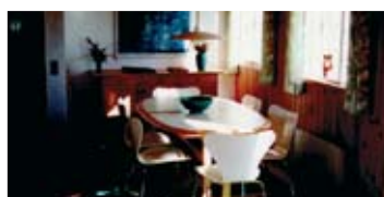
Fanø 2 plans hus med 6 sengepladser, sauna, opvaske- og vaskemaskine.